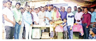
देवरी : दिनबंधु ग्रामीण विकास संस्था देवरी आणि सुवर्णप्राशन फाउंडेशन साकोली तसेच मित्र