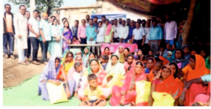
पथरटोला येथील साहित्य वाटप कार्यक्रमास उपस्थित सामाजिक कार्यकर्ते.

लोकमत न्यूज नेटवर्क देवरी : अंधारानुसार प्रकाशकडे घेऊन जाणारा भारतीय संस्कृतीतील दिवाळी हा महत्वाचा सण, समाजातील प्रत्येक कक्षांनी आपल्या सोबित्यानी साजरा करून घेतात. पंतुं समाजात अंधेरी काही घटक आहेत जे हा सण साजरा करण्यापासून वंचित राहतात, अशा वंचित कुटुंबातील सहभागी होऊन त्यांच्या आनंदात आनंद मिळवून देण्यासाठी दिनबंधु ग्रामीण विकास संस्था देवरी, सुवर्णप्राशन फाउंडेशन साकोली व मित्र संस्थेच्या संयुक्त विद्यमाने येथे चार वर्षांपासून आमची दिवाळी वंचितांसाठी हा उपक्रम राबविला जात आहे.