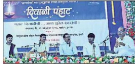
Artists performing at the Diwali Pahat event.